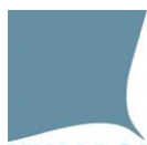
Tabella 3.6. Programma delle interviste durante la visita di valutazione esterna – Circoli didattici